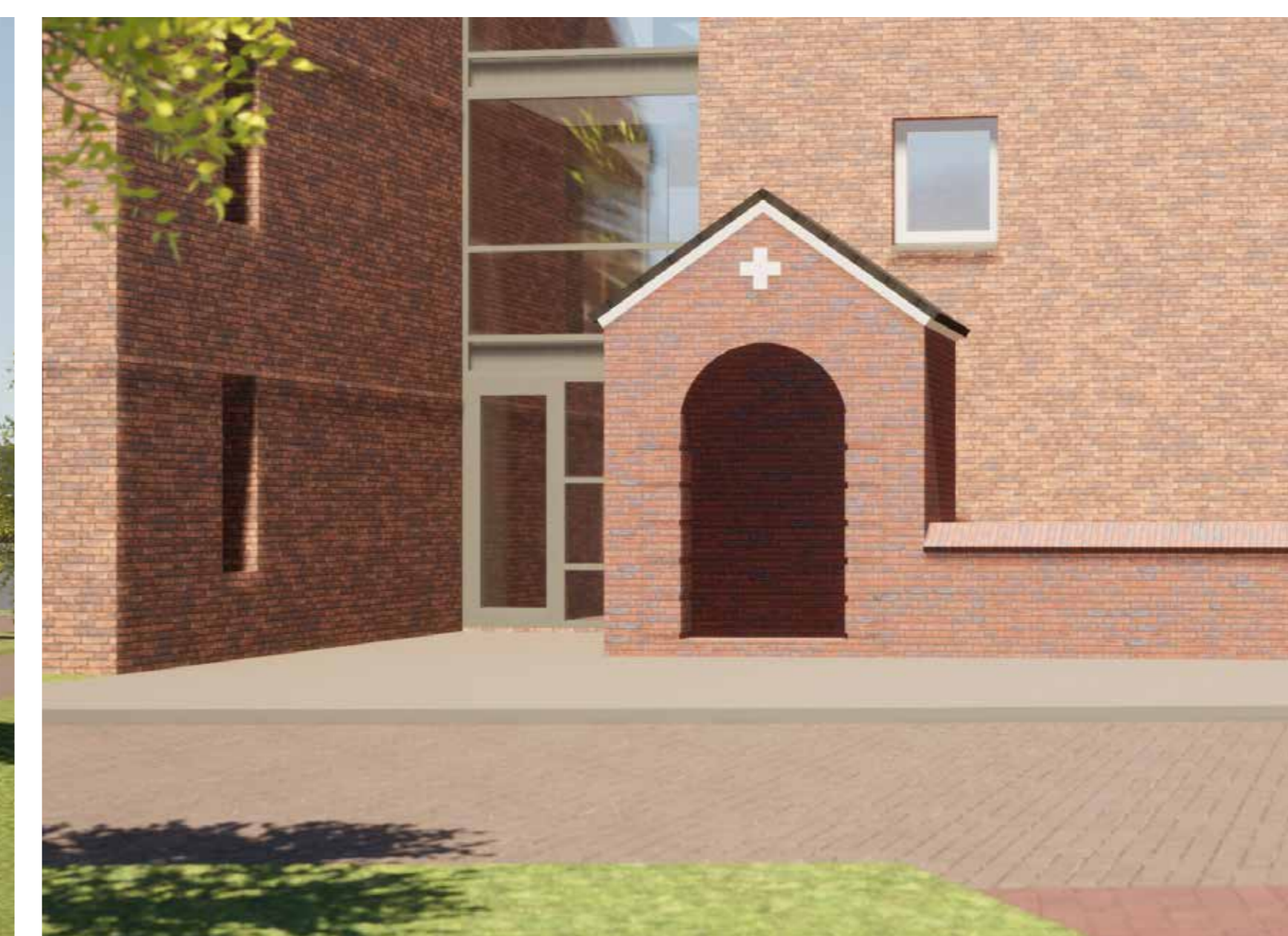
KAPEL BLIJFT BESTAAN