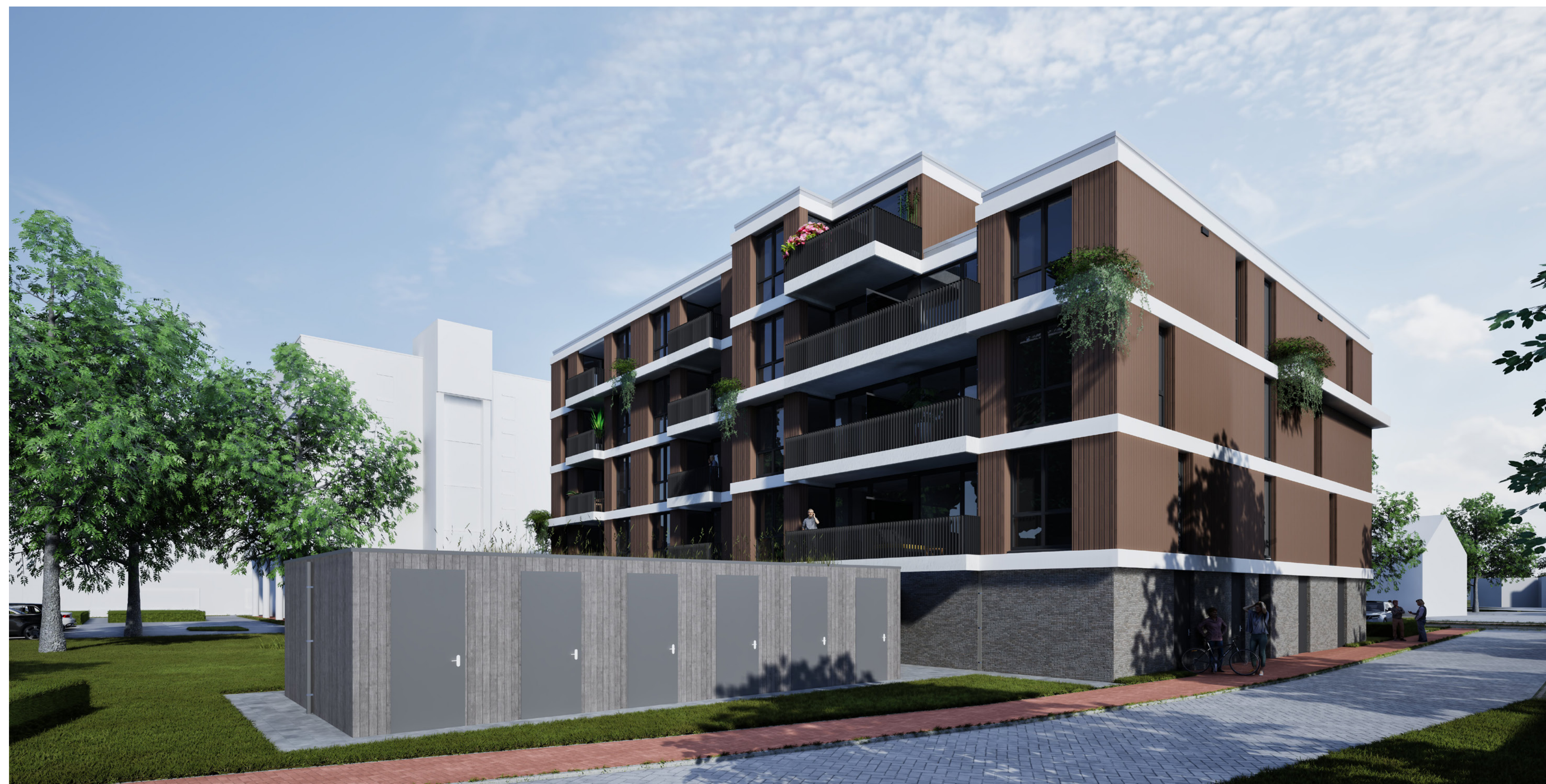
Aanzicht vanaf Molenhof