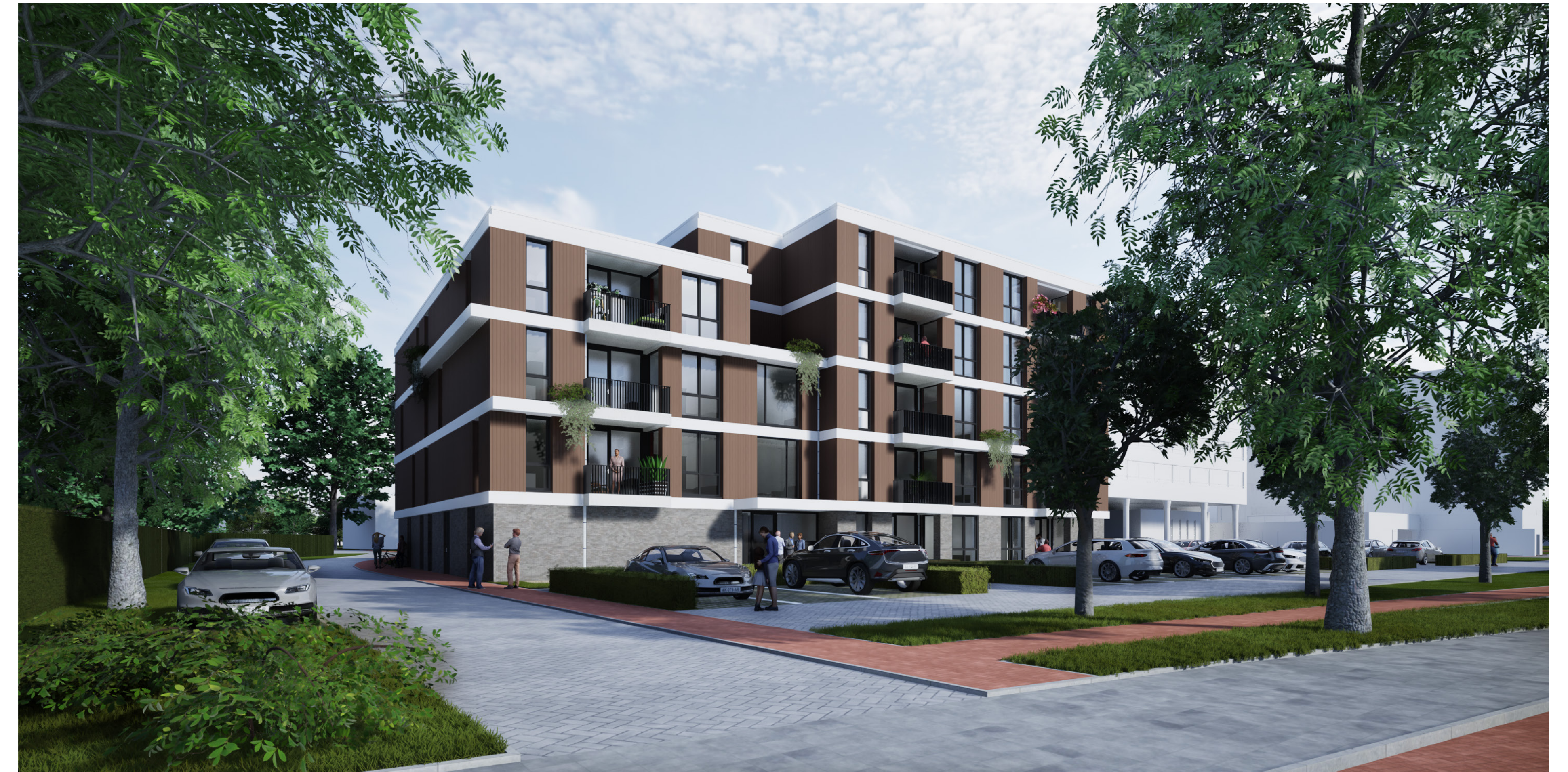
Aanzicht vanaf Achterberghstraat