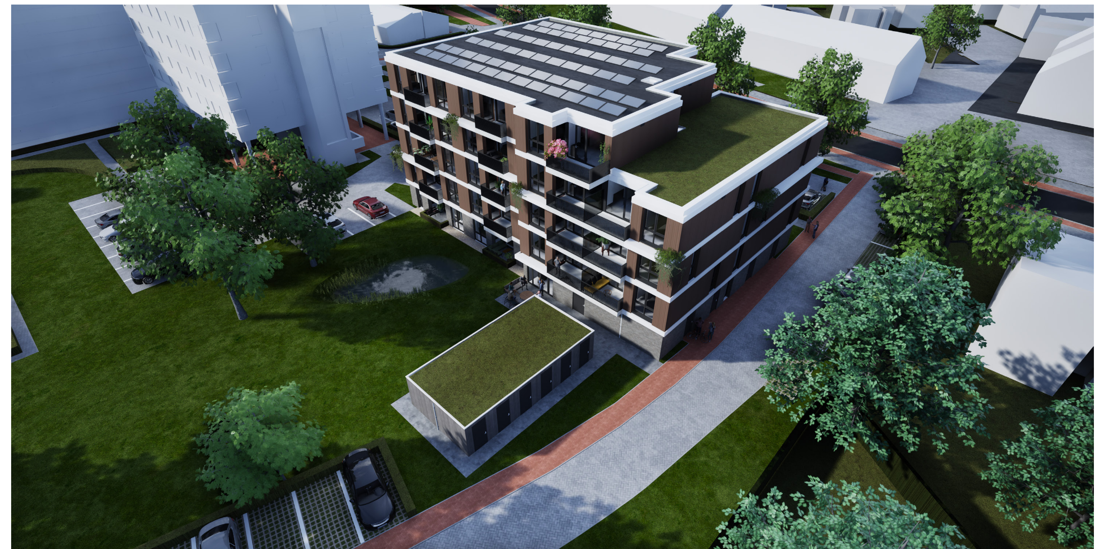
Vogelvlucht gezien vanaf Molenhof