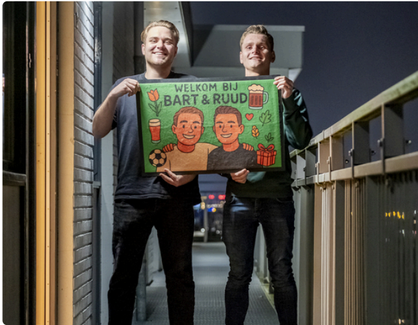
Introductie friendscontracten: tijdelijke huurders Hintham delen samen een woning.