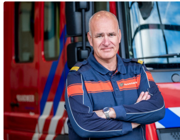
Aanpak brandveiligheid in flats en complexen: Brandveilig wonen is prettig wonen