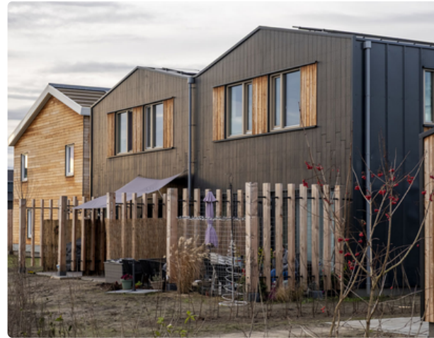
STEK is klaar: De Grootte Wielen is 201 duurzame woningen én bruisende buurt rijker