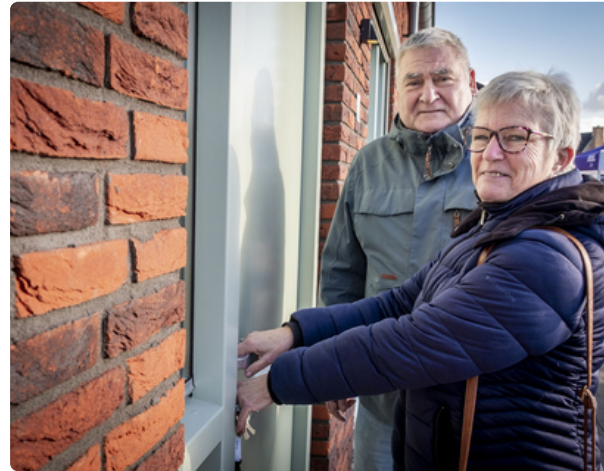
Feestelijk oplevering 5 nieuwe huurwoningen in Loosbroek: Ruim 1200 belangstellenden