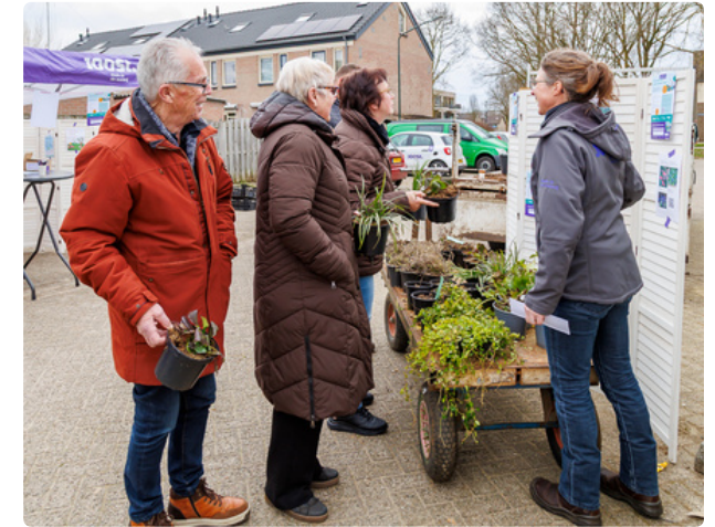
Samen Groen Doen Dag in Boxtel: Partners bundelen krachten voor fijne groene buurten