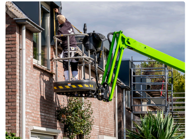
16 eengezinswoningen verduurzaamd: Pastoor Manderstraat en Het Gescheurd Hemd