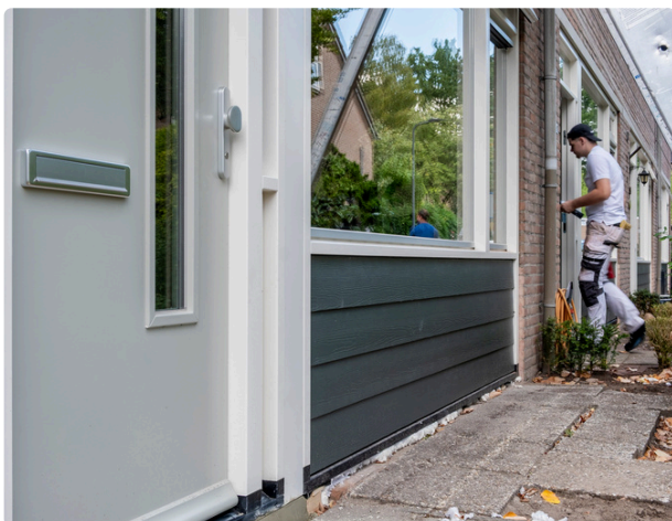
59 woningen energiezuiniger: Groot onderhoud Heihoeven Rosmalen