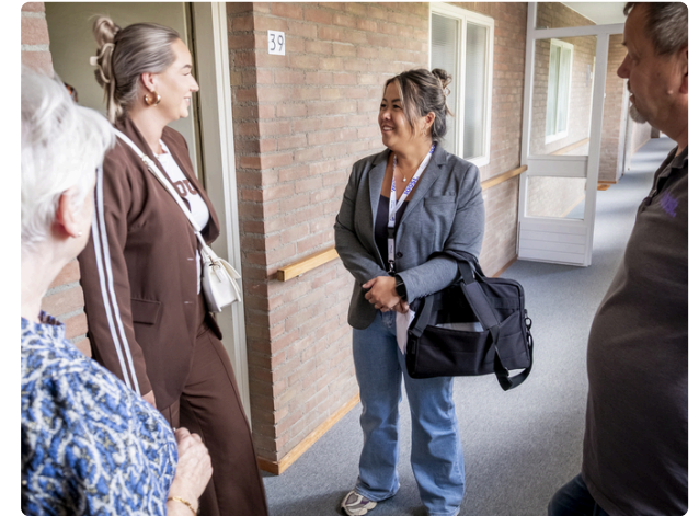
Van start met groepsbezoeking: Woningen sneller verhuren