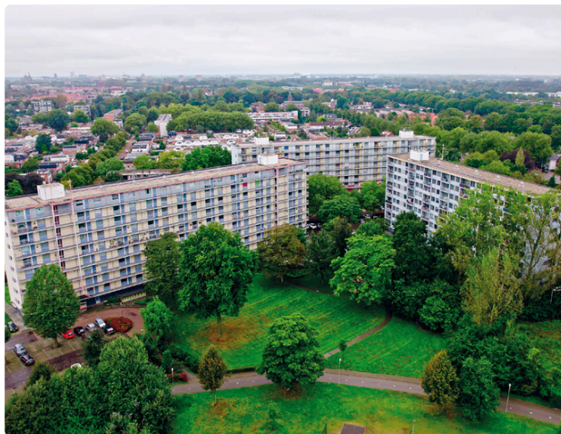
Positieve inzet wijkteam bij herontwikkeling flats Hintham: Sociaal Plan voor huidige bewoners