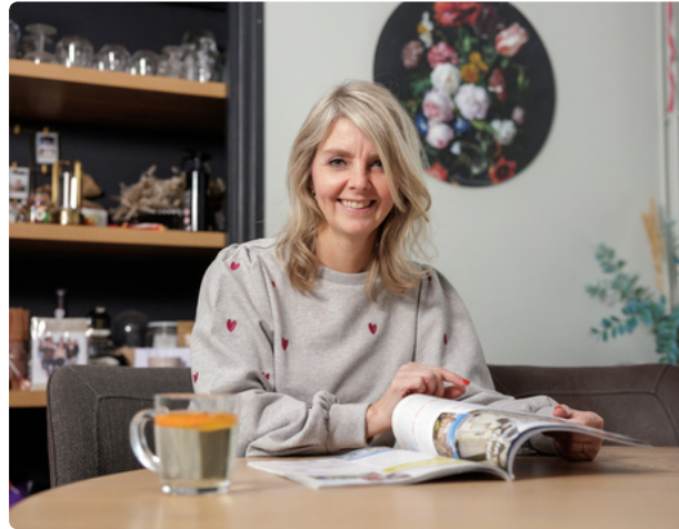
Lancering nieuwe Koers van JOOST: Samen sterker – Vandaag kiezen voor het verschil van morgen