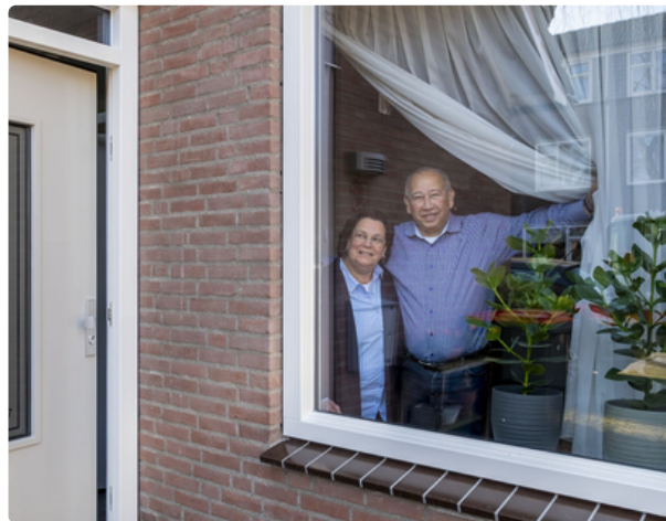
Groot onderhoud 66 woningen in Rosmalen: Ervaringen van bewoners