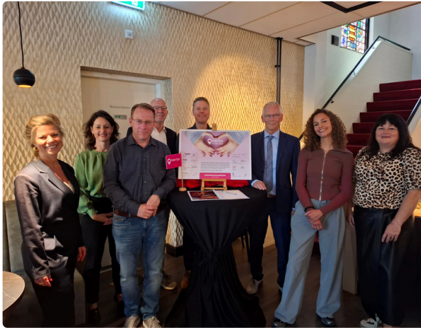
Samen verder bouwen aan Hartjes in de Wijk: Gastvrije ontmoetingsplek voor Boxtelse wijkbewoners

Waar hebben we ons in 2025 voor ingezet?