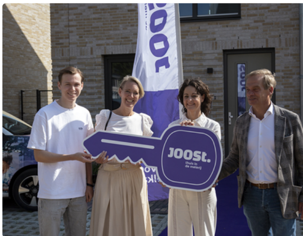
Laatste 16 huurwoningen Heem van Selis in Boxtel: In totaal 47 huurwoningen in deze nieuwe wijk.