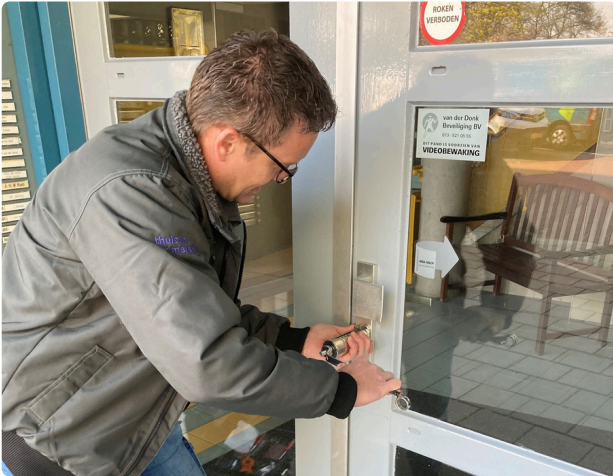
Trots op onze eigen onderhoudsdienst: Een 8,4 in de Aedes-Benchmark