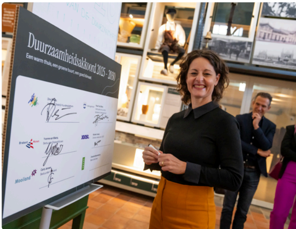
Nieuw duurzaamheidsakkoord gemeente Den Bosch: Samen met gemeente, Stedelijk Huurdersplatform en Bossche corporaties

Waar hebben we ons in 2025 voor ingezet?