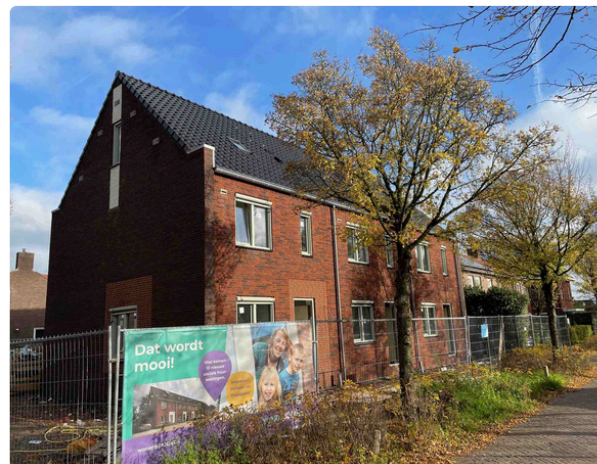
10 nieuwe huurwoningen Sassenheimseweg: Oude huurders keren terug.