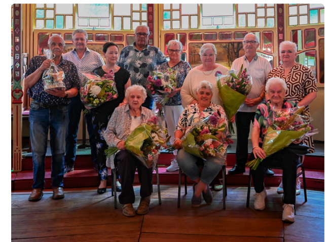
Gouden Huurders en vrijwilligers in het zonnetje: 15 actieve bewonerscommissie en 4 in oprichting